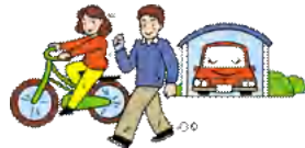
スマート通勤手段 (キャンペーン期間合計) (n=1715人・日)

また、 約4割のサポーターが、自分で立てた目標をクリア できたと回答がありました。